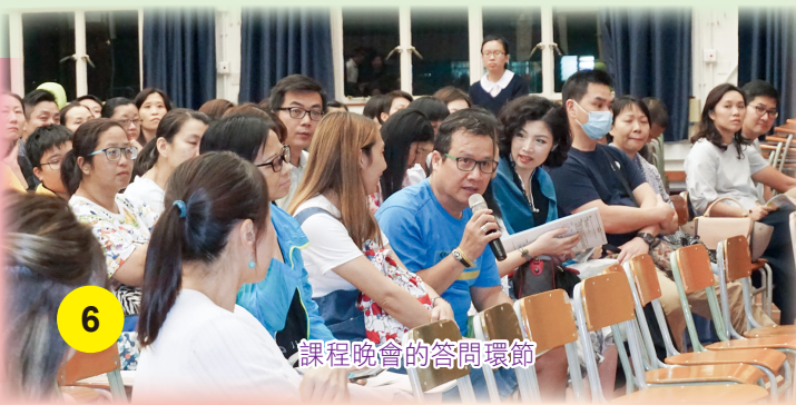
課程晚會的答問環節

每年開學前後，為了讓中一新生的家長們，有機會清楚校方運作、教學方針等等，本會均會協助學校舉辦中一家長會和初中課程晚會。這都成為家長了解子女們在校就讀情況的首次機會。