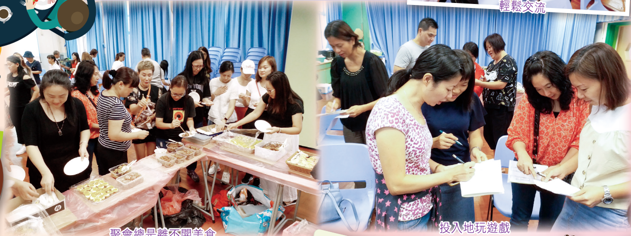
聚會總是離不開美食