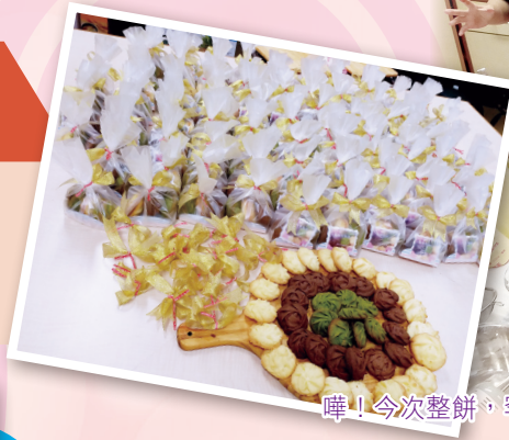
嘩！今次整餅，罕有地有爸爸的參與

本會委員用心焗出精緻美味的小曲奇餅，配上華麗包裝，送給全體老師，表達敬意，亦傳遞感謝心意。